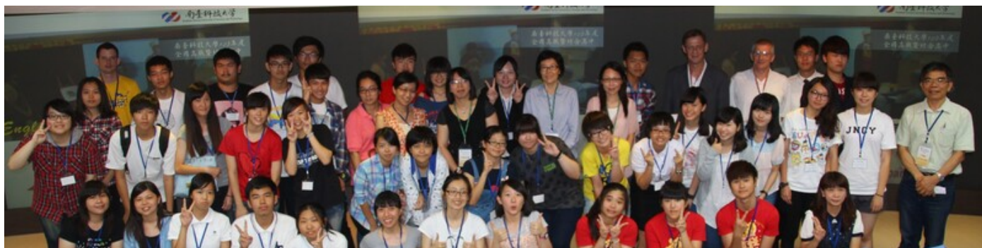
102年度全國高職暨綜合高中英語說故事比賽合照