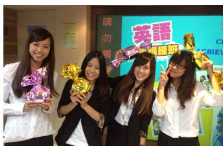
102 年度學生活動照片