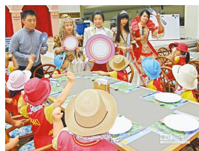
墾丁福華飯店今年邀請本系舉辦夏令營，推出情境話劇，以英語介紹西餐禮儀。

另外，墾丁凱撒飯店推出夏季活動營，內容包括塑沙、學習國際禮儀、房務和餐廳實習、手作烘焙餅乾和巧克力等活動。墾丁夏都酒店推出「夏都兒童俱樂部」包括生態探險之旅、尋寶趣味、海盜船競賽、小小鐵人三項、探訪寄居蟹的家、水中尋寶活動。生態探險之旅、尋寶趣味、海盜船競賽、小小鐵人三項、探訪寄居蟹的的家、水中尋寶活動。(見 2014 年 06 月 14 日 04:10 中國時報)