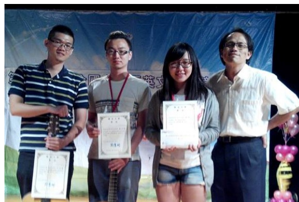
英語歌曲創作大賽頒獎典禮（上圖）