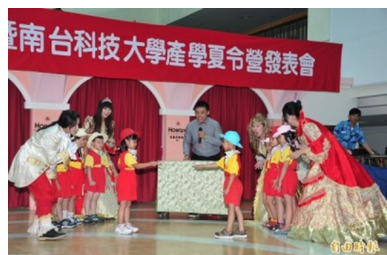
本系同學穿著華麗公主服裝，帶著孩子們表演情境話劇。