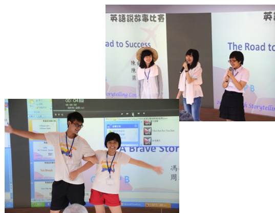
學生精彩表演(上左圖)

本次活動從前置作業的準備到活動當天之行程運作，應用英語系全力支援，並承校內各方之協助，於決賽當日順利完成活動。