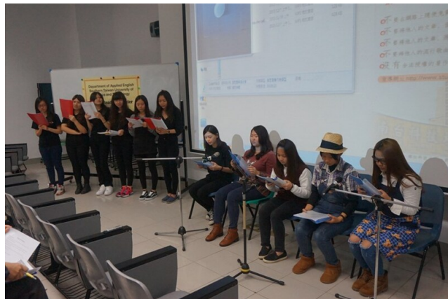
▲圖為語調的抑揚頓挫、聲音表情與肢體語言，讓觀眾彷彿聆聽一場精采英語廣播劇