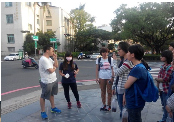
▲圖為學生實際模擬英語導覽台南氣象台，原台南測候所

好投入這英語導覽藍海呢? 趕快加入「文化觀光專業英語」課程，一起來翻轉台灣的旅遊服務產業吧